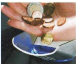
Acepta y verifica 3 monedas por segundo