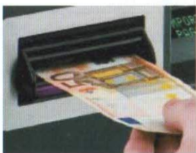
Todos los billetes aceptados son auténticos